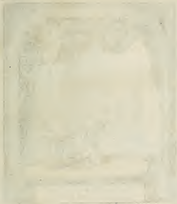
Figure 1: [Illegible text]